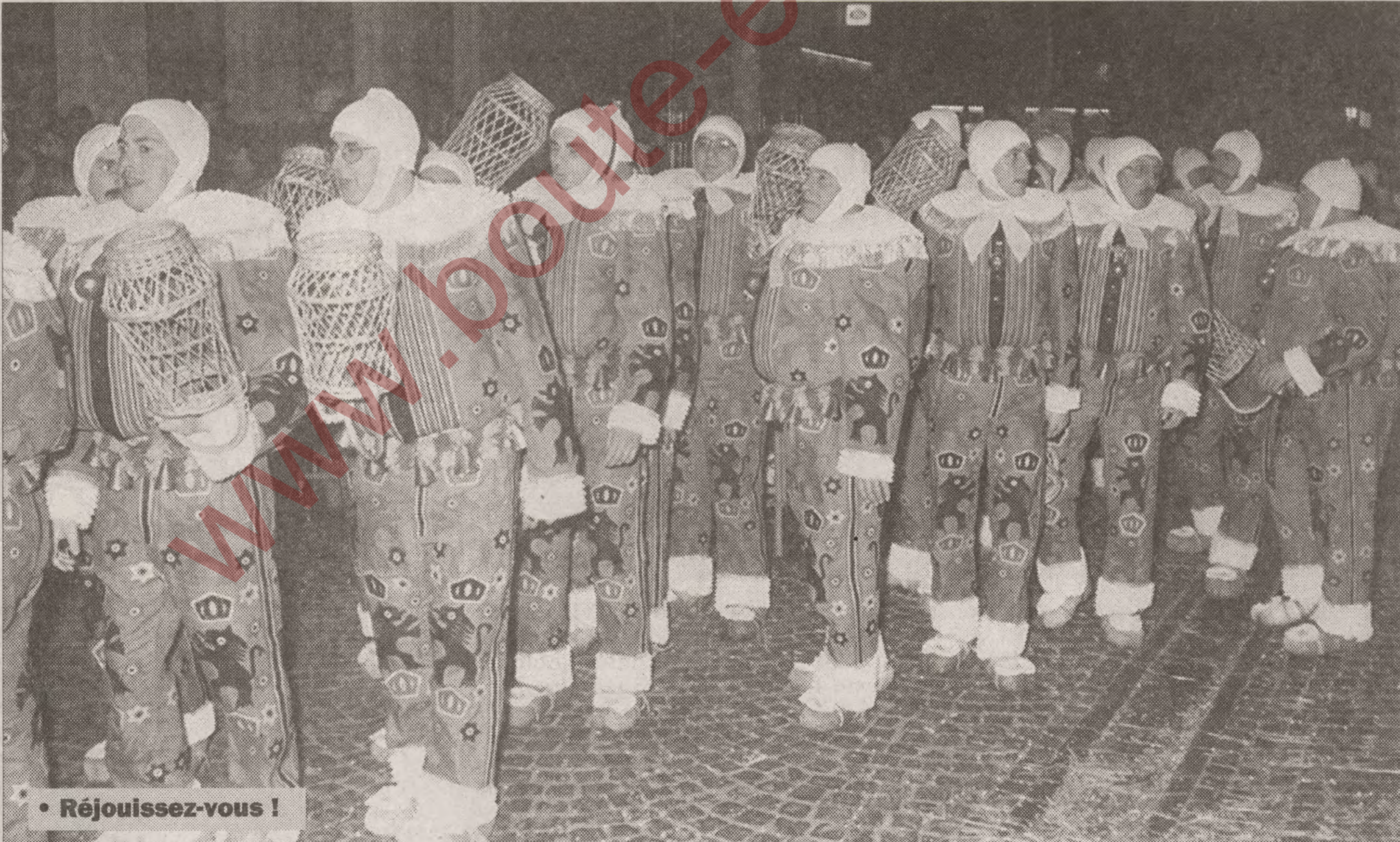
• Réjouissez-vous !