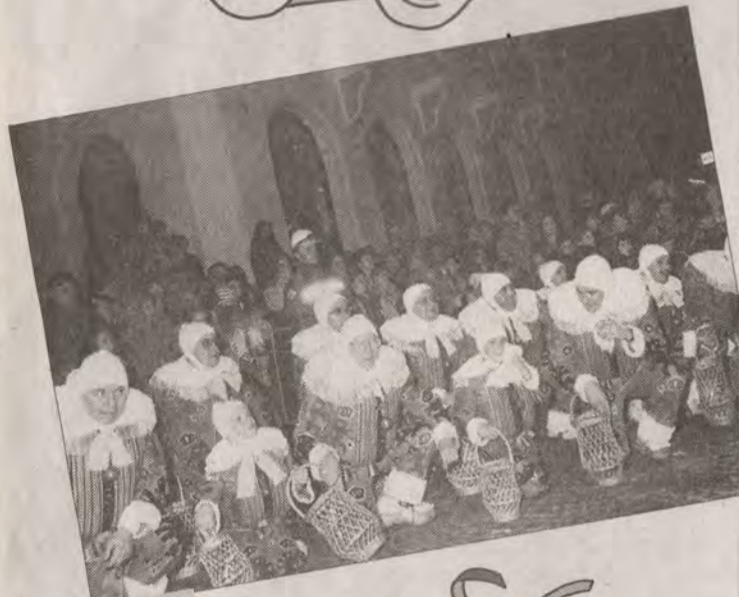
• Les Boute-en-Train pleurent la fin du laetare

Nuitamment, les Boute-en-Train ouvrent la série des brûlages des bosses. C'est encore un impressionnant rondau de fièvre collective qui se communique ardemment sur la Place Mansart devant des milliers et des milliers de carnavaliers fidèles. Millésime 97, un fameux numéro-souvenir en cette fin de siècle. Carnaval ne périra jamais dans cet élan populaire. M.H.